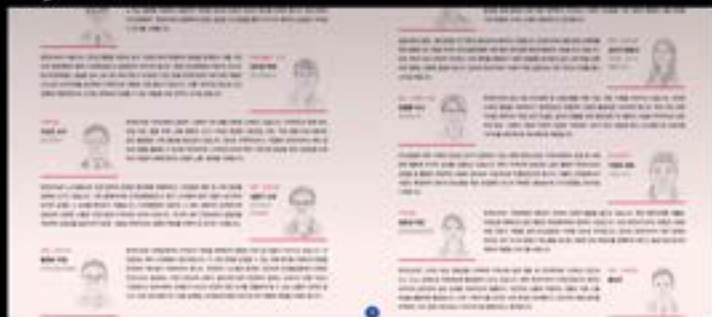
트렌드 및 고객니즈를 반영한 이해관계자 인터뷰 페이지 구성