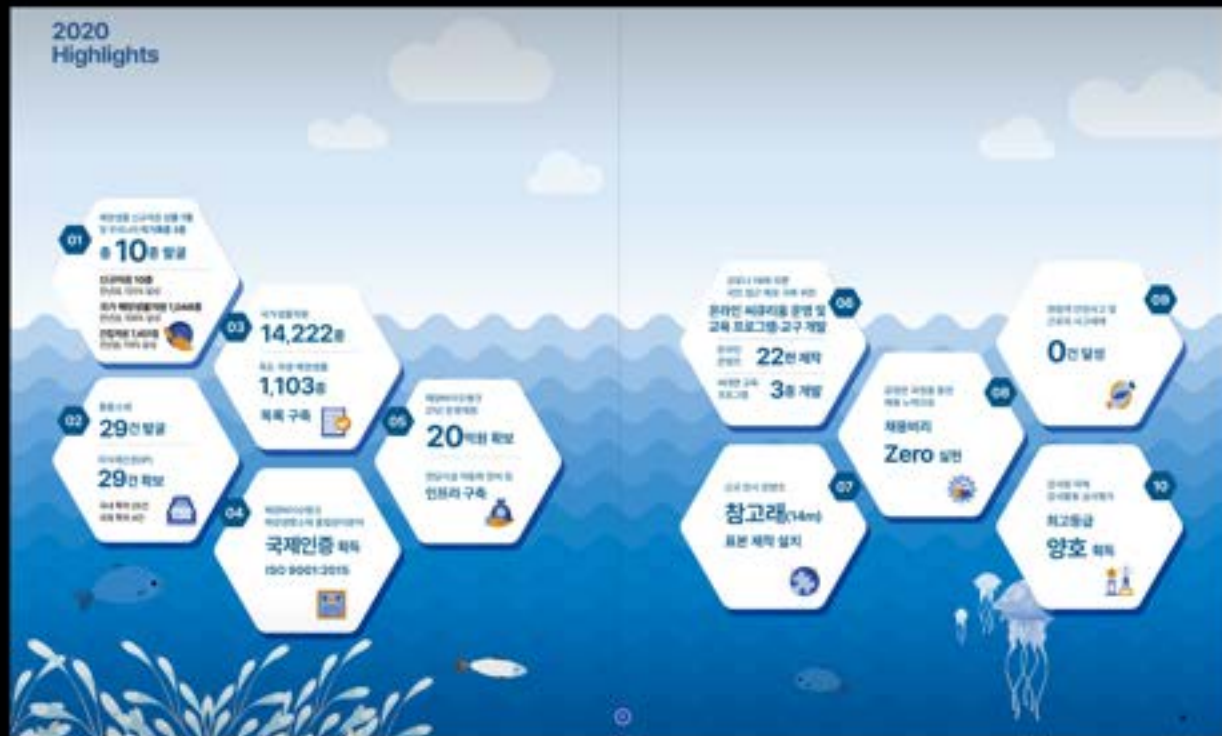
정량적 데이터를 직관적으로 강조한 주요성과 제시