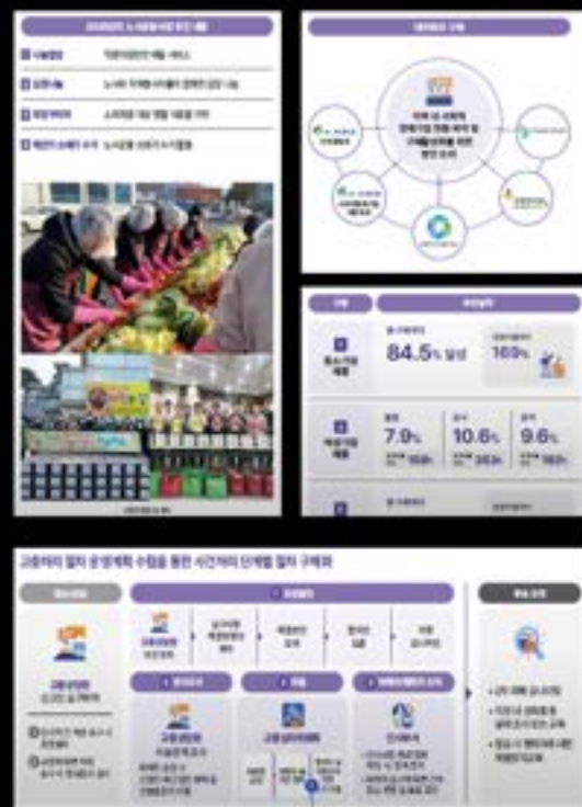
촬영사진, 아이콘, 일러스트 등을 적절히 활용한 성과제시