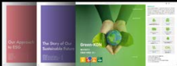
기관의 Value를 드러낼 수 있는 카피와 조화로운 이미지를 함께 제시