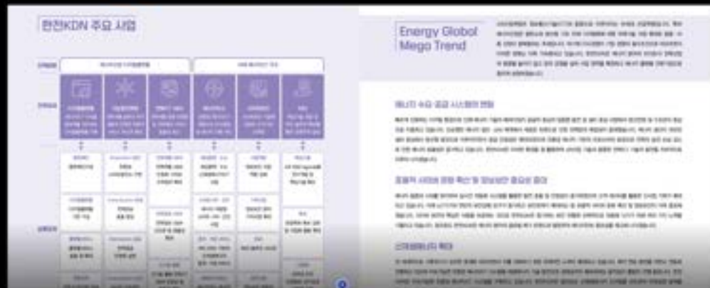
가독성을 살린 다채로운 레이아웃 구성